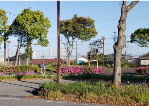
青堀駅前に朝6時30に集合

お忙しいところ恐縮ですが、今後の活動に皆様のご協力をお願い致します。本日も宜しくお願い致します。