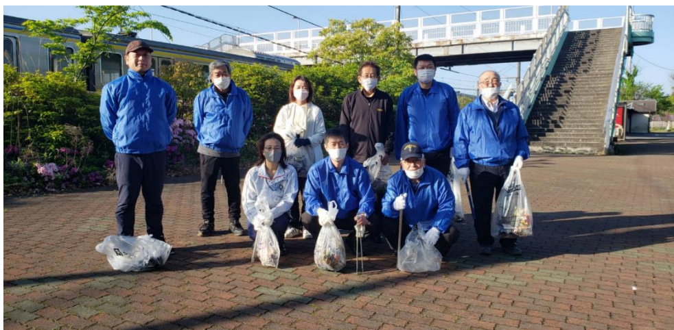
皆さんお疲れさまでした。