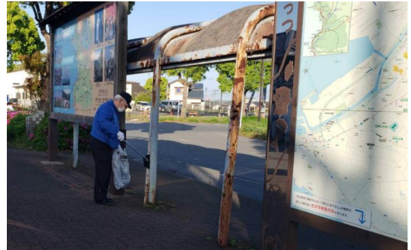
早速ゴミ拾い開始