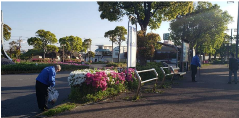
何年経ってもゴミはなかなか減りません。