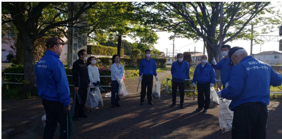
とてもきれいになりました。